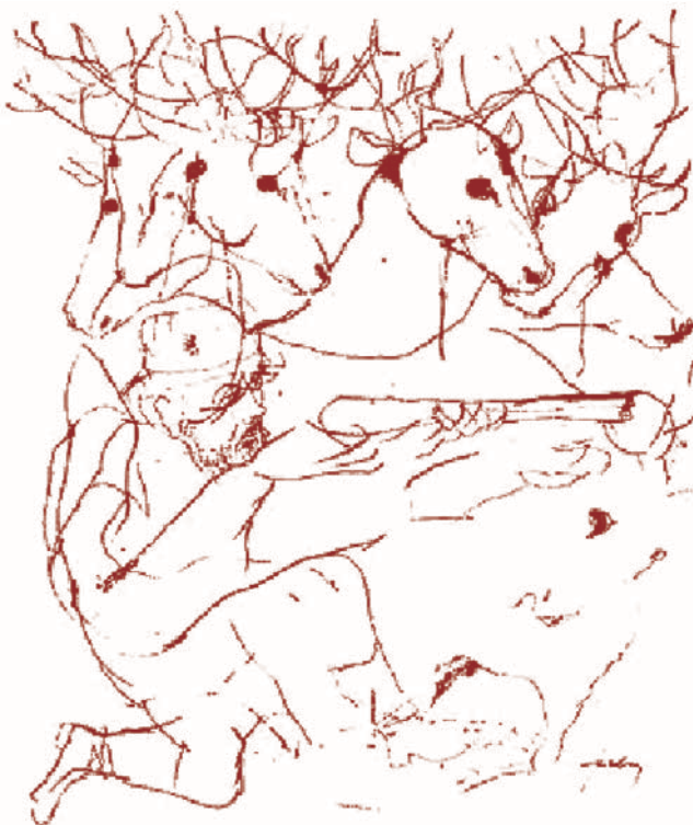
Szalay Lajos: Cantata Profana

Bízunk benne, hogy ez a sokszínű, komplex rendezvény sokak érdeklődését felkelti, és ellátogatnak intézményünkbe 2006. április 22-én.